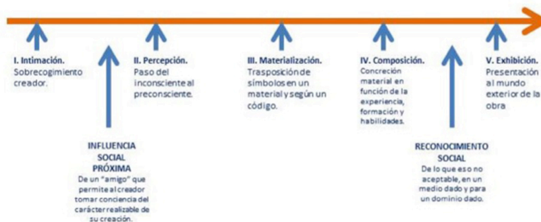
Figura 2.- Modelo del proceso creador. Fases.